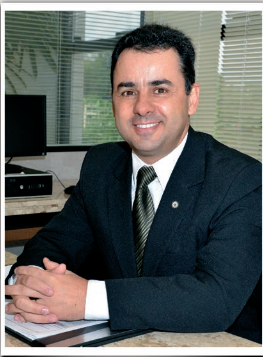
FALE COM O PRESIDENTE (48) 9914-0076 / presidencia@crcsc.org.br